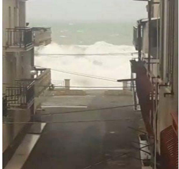
Gazzetta del Sud 26 marzo 2020 _ Mareggiata a Cirò Marina