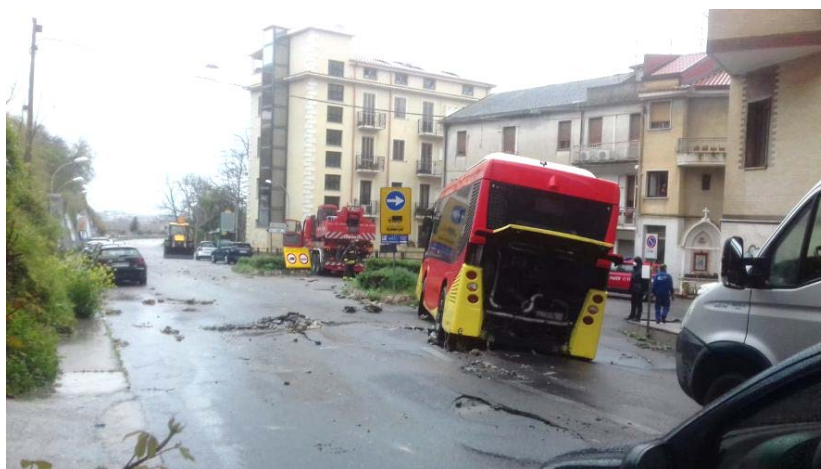
Gazzetta del Sud 26 marzo 2020 _ A Catanzaro un pullman dell'Amc sprofondato in una voragine in Via Alessandro Turco