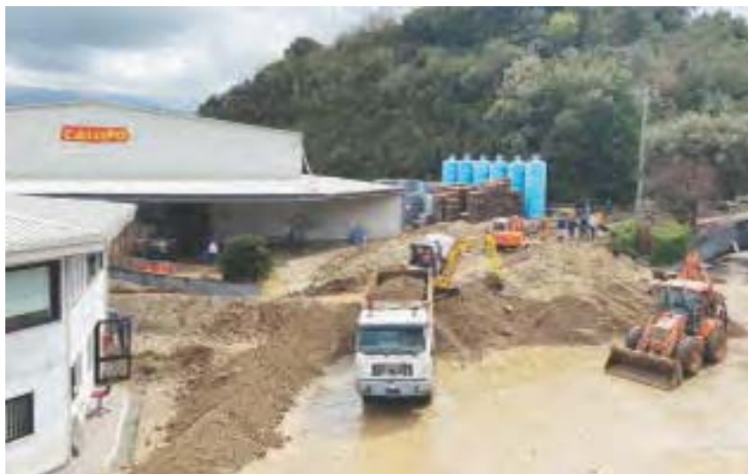
Quotidiano del Sud 1 aprile 2020 _ Nubifragio devasta il Vibonese. Colpito stabilimento di Callipo