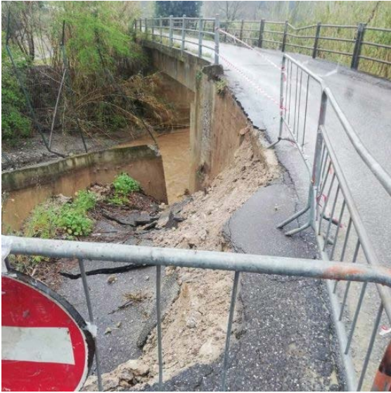
Gazzetta del Sud 26 marzo 2020 _ Frane ed esondazioni a Maida