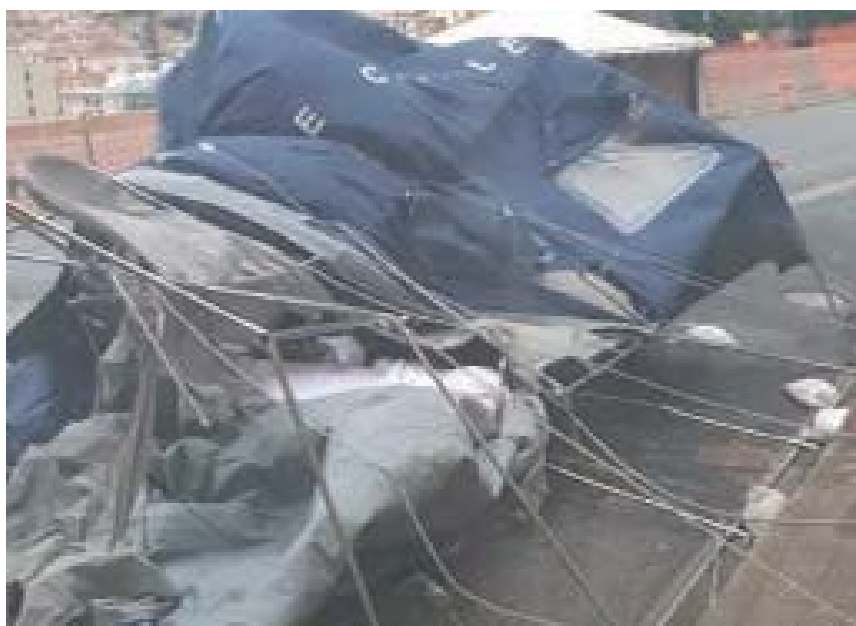
Quotidiano del Sud 27 marzo 2020 _ Paola sferzata dal vento