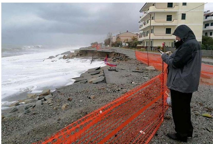
www.ilreggino.it 26 marzo 2020 _ Lungomare di Bova Marina distrutto dalla mareggiata