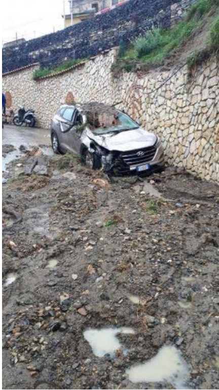
Gazzetta del Sud 26 marzo 2020 _ Catanzaro in Via Corrado Alvaro