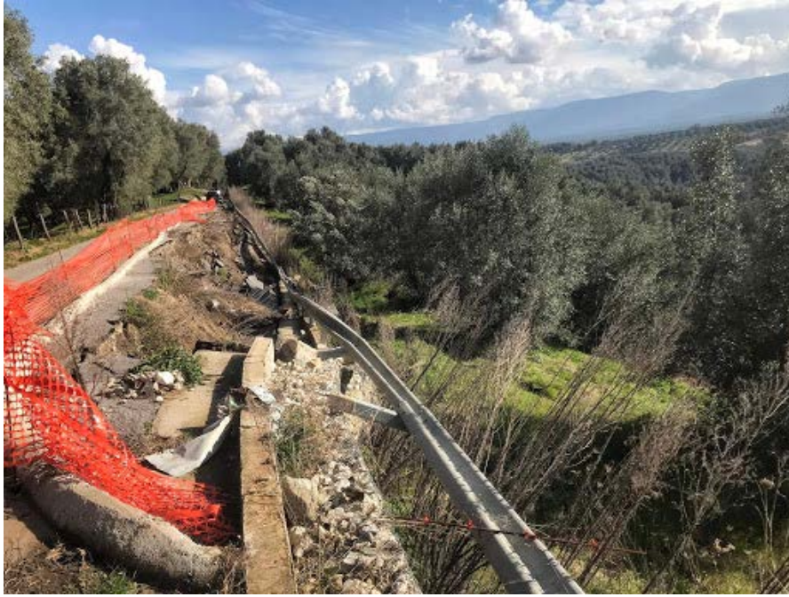
Strettoweb 31 marzo 2020 _ Frana a Seminara