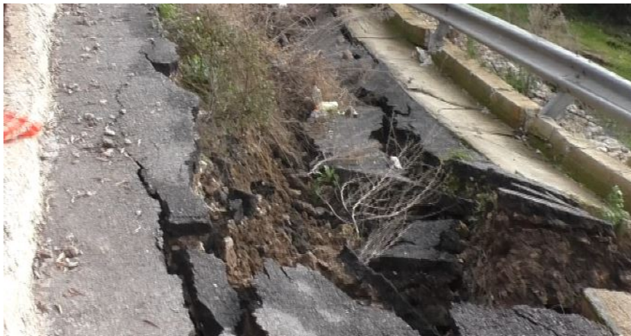
LaCNews24 31 marzo 2020 _ Frana a Seminara