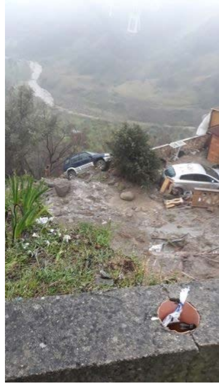
Gazzetta del Sud 26 marzo 2020 _ Smottamenti a Catanzaro