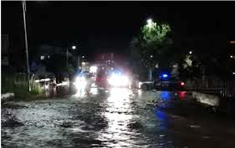
Quotidiano del Sud 31 marzo 2020 _ Allagamenti nel Vibonese