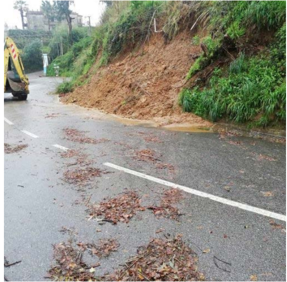
Gazzetta del Sud 26 marzo 2020 _ Smottamenti a Maida