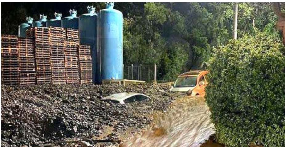
Cn24Tv 31 marzo 2020 _ Fango e detriti nel Vibonese. A Maierato allagato stabilimento di Callipo