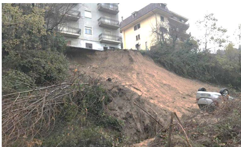
www.Inmeteo.net 26 marzo 2020 _ Frana a Celico