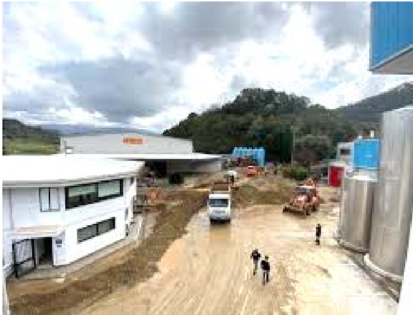
Corriere della Calabria 31 marzo 2020 _ Nubifragi, allagamenti e smottamenti nel Vibonese