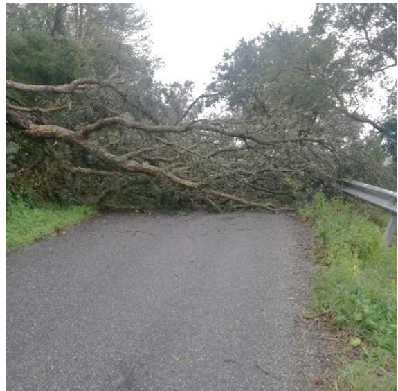
Gazzetta del Sud 26 marzo 2020 _ Alberi caduti a Maida