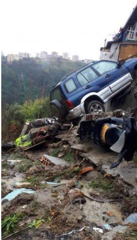
Gazzetta del Sud 26 marzo 2020 _ Auto inghiottite da smottamenti in pieno centro a Catanzaro