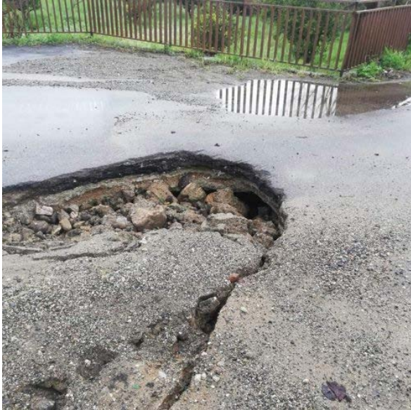
Gazzetta del Sud 26 marzo 2020 _ Smottamenti a Maida